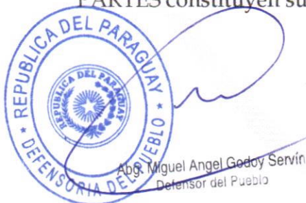
Abg. Miguel Angel Godoy Servín Defensor del Pueblo

CLÁUSULA OCTAVA: Para todos los efectos que pudieran corresponder, LAS PARTES constituyen sus domicilios legales en sus respectivas sedes.